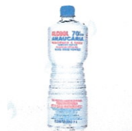
Alcool Liquido Araucaria 70° - 1L

Valor de mercado na internet R$8.24/ Valor apresentado pela LIDERANÇA – R$2.78