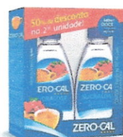
Kit Zero Cal Sucralose 100ml 2 Unidades

O edital frisa que "Todos os produtos que forem fornecidos pela Contratada deverão ser de 1ª qualidade e sujeitos à prévia aprovação do BANDES, especialmente, papel toalha, sabonete líquido, adoçante, copos descartáveis e papel higiênico, devendo ser entregues no almoxarifado da Contratada, localizado nas dependências do BANDES"(apêndice III, anexo I. item 2)